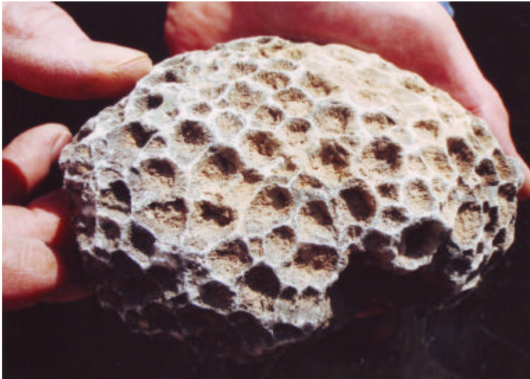
Argutastrea cf. quadrigemina (Goldfuss, 1826) Oberes Mitteldevon