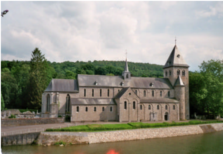
Abteikirche Notre Dame (Maasländische Romanik) in Hastière-par-delà

Die um das Jahr 1000 entstandene Abteikirche der Cluniazenser hat über die Jahrhunderte vielfältigen Angriffen standgehalten und bietet noch heute eines der schönsten Beispiele der Maas-Romanik. Die Kirche ist auch durch seine Kunstwerke als besuchenswert zu empfehlen.