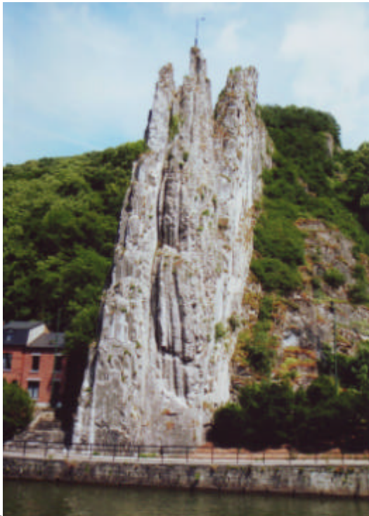
Rocher Bayard (Unterkarbon) südlich von Dinant

Die kleine Stadt Dinant, die „Perle der Ardennen“, liegt eingebettet zwischen steil stehenden Kalkfelsen des Unterkarbons und grünen Hügeln am Ufer der Maas. Wahrzeichen der Stadt ist die Stiftskirche Notre Dame mit ihrem außergewöhnlichen Zwiebelturm in einer Nische dieser imposanten, steil und hoch aufragenden Kalkfelsen. Die 30 m lange, dreischiffige Anlage der frühen Gotik (1229 und 1247) zeigt insgesamt schlichte Formen. In der Stadt steht auch das Geburtshaus von Adolphe Sax (1814-1894), dem Erfinder des Saxophons. Bekannt ist Dinant seit langem für seine handwerklichen Messingprodukte, die als „Dinanderien“ bezeichnet werden. Die hoch gelegene Zitadelle beherrscht die Stadt und das Tal der Maas. 1051 erbaut, erfolgte 1703 die Zerstörung durch französische Truppen. Den Wiederaufbau und damit seine heutige Gestaltung u.a. mit der in den Fels gehauenen Treppe (408 Stufen) erfuhr sie Anfang des 19. Jh. während der Besetzung durch die Niederlande. Spuren hinterließ vor allem auch der 2. Weltkrieg.